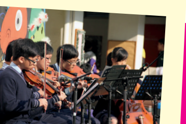
▲該校學生在各類校際比賽中亦屢獲殊榮，盡顯藝術才華。