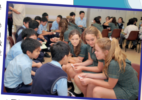
▲學校為多方面推廣英語學習風氣，定期邀請國際學校學生到校交流。