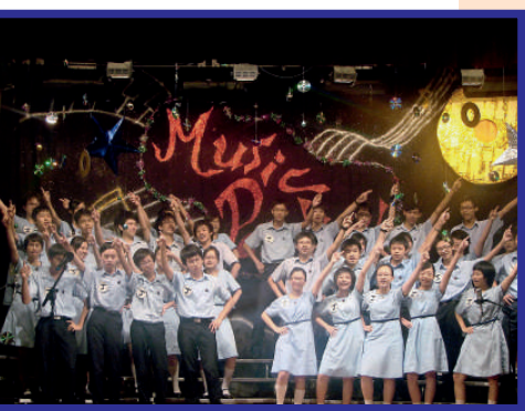
▲除了關注學生學業成績，學校及學生組織亦會舉辦不同類型的班際比賽，訓練學生溝通能力及其他才能。