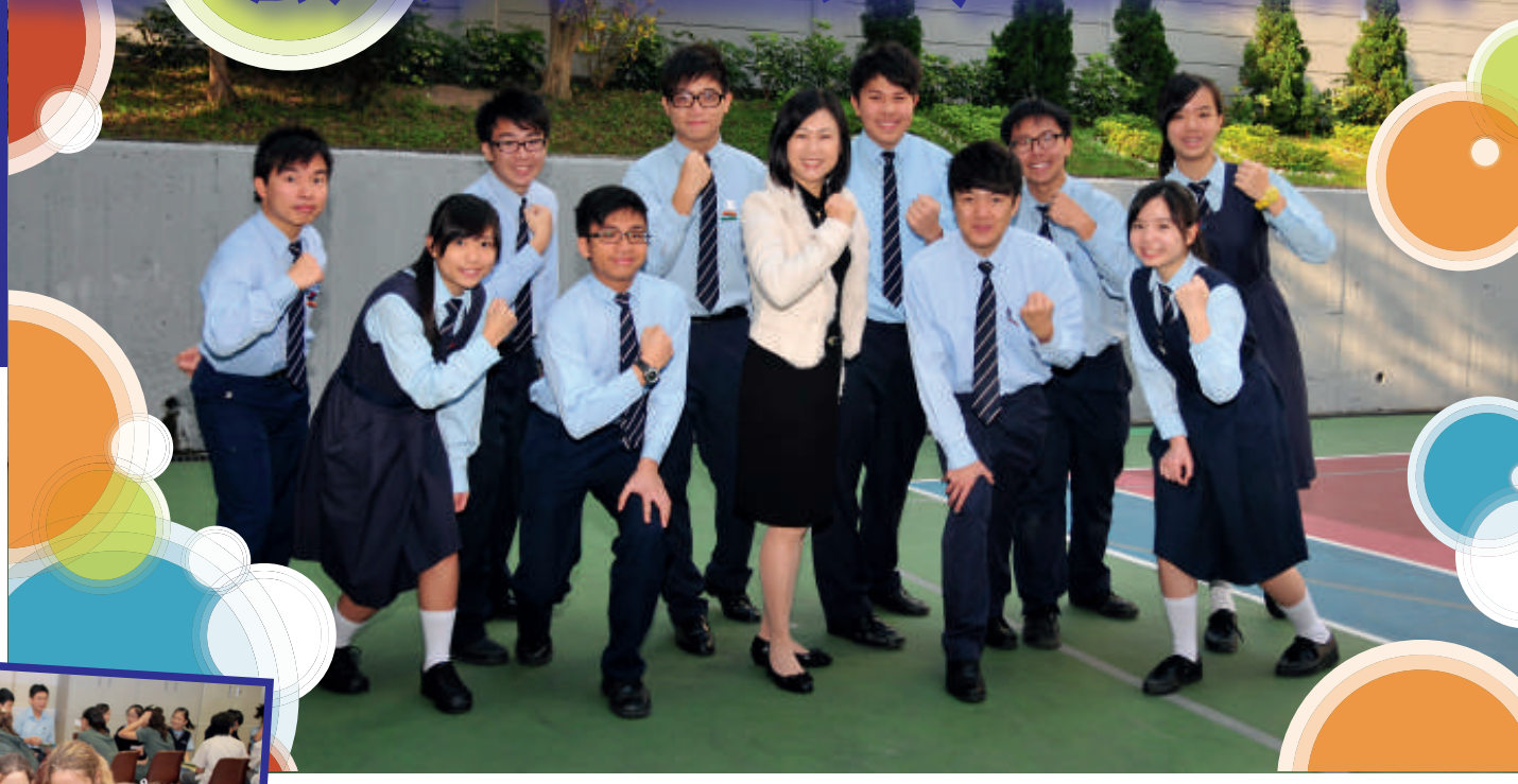
▲旅港開平商會中學師生關係融洽，多年來確立了獨特的和諧校園文化。圖為溫校長（中）與學生會幹事合照。