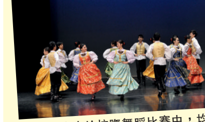
▲每年學生於校際舞蹈比賽中，均取得優異成績。