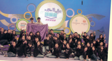
▲該校英語集誦隊可謂校際朗誦節的「長勝將軍」