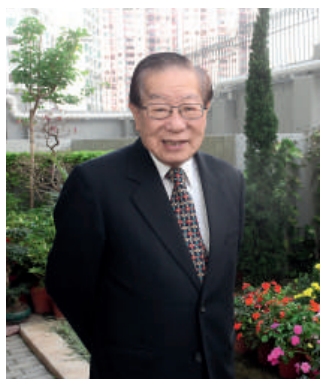
▲關校監服務學校多年，對40周年校慶感到欣慰。

旅港開平商會中學於1973年創校，今年，學校踏入40周年這個重要的里程碑。多年來的發展，旅港開平商會中學無論在學術成績、課外活動及校風品德方面，均表現突出，為區內學校楷模。為慶祝創校40周年，學校除計劃舉辦一系列慶祝活動外，更組織學生聯同校友會整理學校文物及歷史資料，期望讓更多人了解學校歷史，達致回顧過去、展望未來的目標。