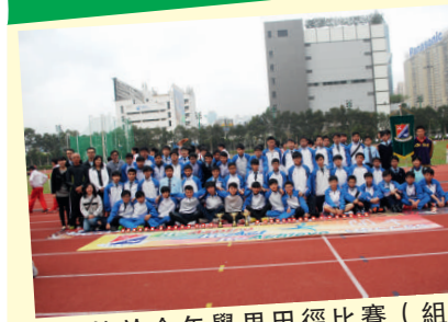
▲學校於今年學界田徑比賽（組別一），奪得男子組團體季軍，緊隨拔萃男書院及喇沙書院，為學界田徑三哥。