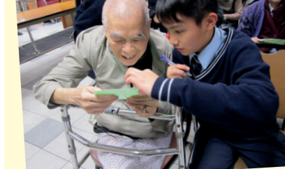
▲學生從參與義工服務中，學習關懷社會有需要的人士。